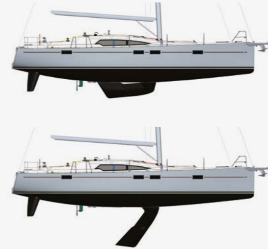
QUILLE RELEVABLE LIFTING KEEL