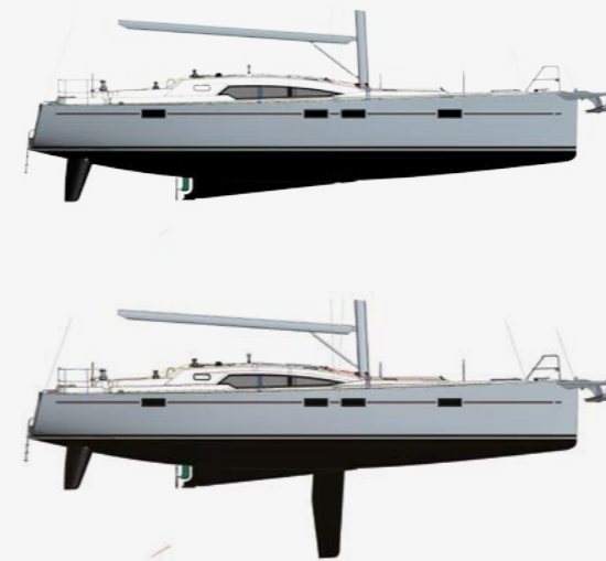
DÉRIVEUR INTÉGRAL CENTREBOARD

Ingenious layouts, unhindered access to equipment, high-capacity tanks, and a multitude of other practical details to make daily life at sea easier.